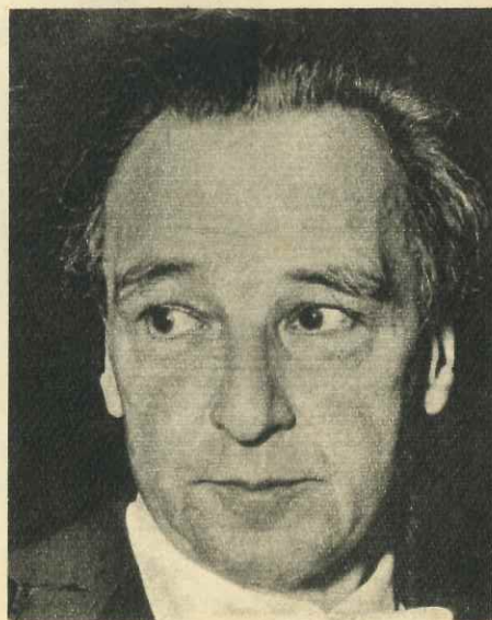
Honegger: El bello fragmento.

Cuando, el 18 de diciembre de 1953, el coro y la orquesta de Basilea concluyeron la ejecución de la Cantata de Noël , del suizo-francés Arthur Honegger, los críticos que habían asistido al estreno se confabularon para señalar una común observación: si bien el estilo macizo y definido del compositor no estaba ausente de la obra, su elaboración la acercaba más a sus primeros trabajos que a los de los años inmediatamente anteriores a su muerte (ocurrida en noviembre de 1955).