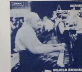
WILHELM BACKHAUS con LA ORQ. FILARMONICA DE VIENA - DIR.: KARL BOHM: Concierto Nº 2 en Si Bemol Mayor, Op. 83 (Para piano y Orq.) (Brahms). London LLC y SLCC 18086