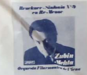
ORQUESTA FILARMONICA DE VIENA - DIR.: POR ZUBIN MEHTA: Sinfonía Nº 9 en re menor (Bruckner). London LLC y SLCC 18082