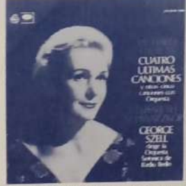
ELISABETH SCHWARZKOPF Y LA ORQUESTA SINFONICA DE RADIO BERLIN - DIR.: GEORGE SZELL (Cantado en alemán): Primavera - Alegria del bosque - Visión amistosa - (R. Strauss) Angel LPC y SLPC 12289