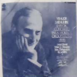
YEHUDI MENUHIN Y LA ORQ. NEW PHILHARMONIA DE LONDRES - DIR.: ANTAL DOKATI - YEHUDI MENUHIN Y NELL GOTT-KOVSKY: Concierto para violín y Orq. Nº 2 - Borisk y otros. Angel LPC 12282 SLPC 12282