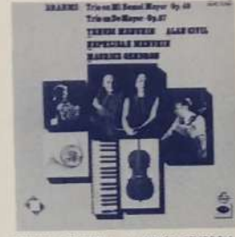
YEHUDI MENUHIN - MAURICE GENDRON - HEPZIBAH MENUHIN - ALAN CIVIL: Trio en Mi Bemol Mayor, Op. 40 - Trio en Do Mayor, Op. 87 - (Brahms). Angel SLPC 12293