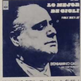
BENIAMINO GIGLI - "La Mejer de Gigli": La paloma - La canzone dell' amore - Anema e core y otros. Angel LPC 12294