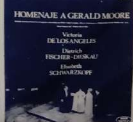
VICTORIA DE LOS ANGELES - ELISABETH SCHWARZKOPF - DIETRICH FISCHER - DIESKAU: "Homenaje a Gerald Moore" Angel AN y SAN 182/183