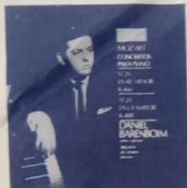
DANIEL BARENBOM - DIR.: LA ORQ. DE CÁMARA INGLESA: Concierto Nº 20 en re menor K. 466 - Concierto Nº 23 en la mayor K. 488 - Mozart. Angel LPC y SLPC 12285