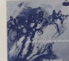
WILLI BOSKOVSKY - DIR.: Y LA ORQ. FILARMONICA DE VIENA - "Celebres Valzas de Strauss": El Danubio Azul, Op. 314 - Sangre Vienesa, Op. 354 - Valsa del Emperador, Op. 437 y otros. London LLC y SLCC 18078