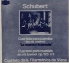
SCHUBERT Cuarteto para cuerdas en re menor "La muerte y la Danzadora" Cuarteto para cuerdas en mi bemol op. 125 nº 1 Cuarteto de la Filarmónica de Viena. London LLC y SLCC 18080