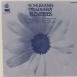
ORQUESTA NEW PHILHARMONIA - DIR.: OTTO KLEMPERER: Sinfonía Nº 1 en Si Bemol Mayor op. 38 "Primavera" - Schumann - Obertura "Manfredo" Op. 115 - Schumann. Angel LPC y SLPC 12287