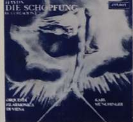
TOM KRAUSE - WERNER KRENN - ELLY AMELING y otros - DIR.: KARL MUNCHINGER: "La Creación" - (Haydn). London SLCC 18089/90