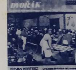
ORQUESTA SINFONICA DE LONDRES - DIR.: ISTVAN KERTESZ: Sinfonía Nº 9 en Mi Menor, Op. 95 (Dvorak). London LLC y SLCC 18087