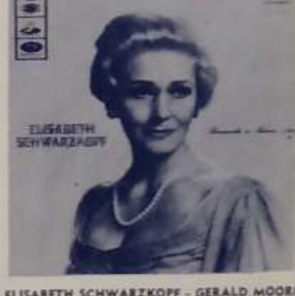
ELISABETH SCHWARZKOPF - GERALD MOORE CON COROS Y LA ORQ. FILHARMONICA DE LONDRES - DIR.: OTTO ACKERMANN: Canciones Favoritas - Arias de Operetas Alemanas. Angel CCA 55054/55