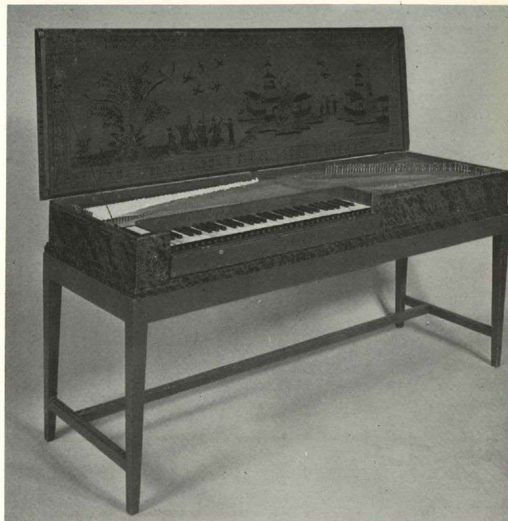
Johann Adolf Hass 1761

Cover: Detail from lid of Hass Clavichord 1761