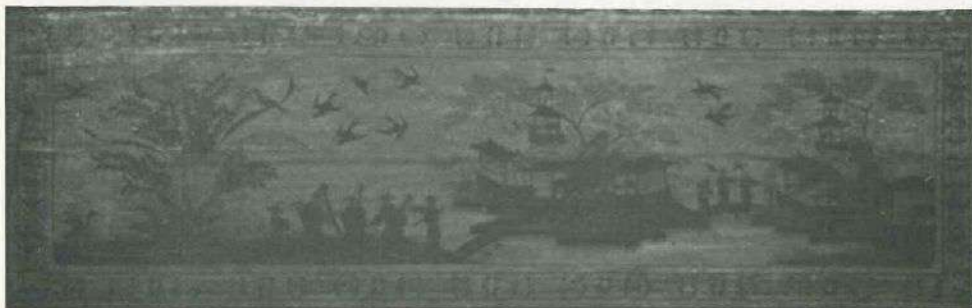
Inside lid of Hass Clavichord

means of added pressure after each stroke'. This device, specific to the clavichord, is called for in several movements of the Sonatas, and it, together with the elaborate and extreme dynamic markings indicates Bach's preferred instrument.